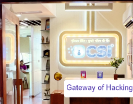
Gateway of Hacking

Ethical Hacking | Cyber Security | Digital Marketing